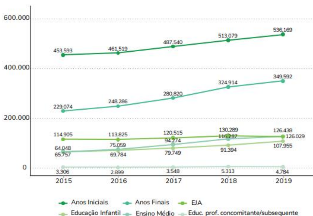
Gráfico 1 - Número de matrículas de estudantes com deficiência, transtornos globais do desenvolvimento ou altas habilidades em classes comuns ou especiais exclusivas segundo etapa de ensino – Brasil – 2015 a 2019