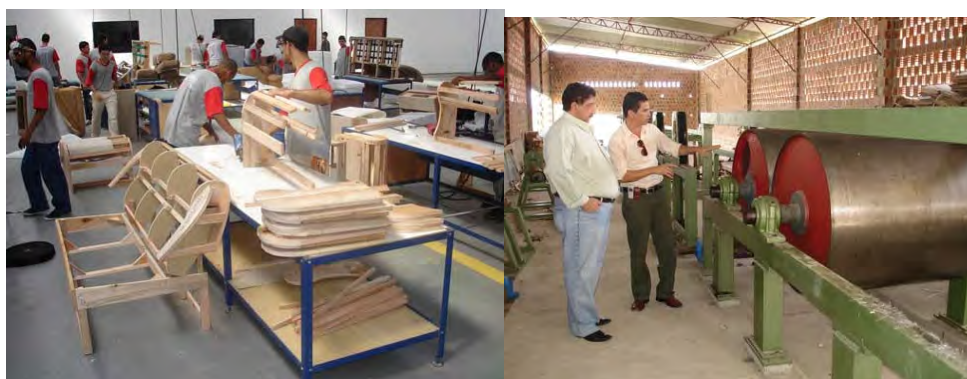
F.65. Fotografia da Fábrica de Móveis Estrela e F.66. Fotografia da Fábrica do grupo DBD.