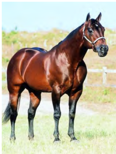
F.60. Fotografia do Cavalo da raça Quarto de Milha (Reprodutor, Mean and Lean). Fonte: Haras Passira. Disponível em: http://www.haraspasira.com.br . Acesso em 30/05/2007.