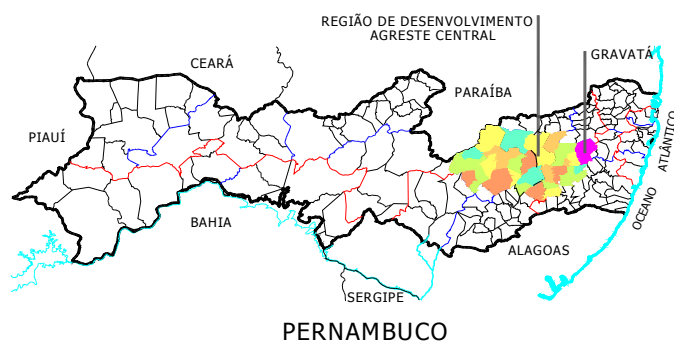
F. 2. Mapa do Estado de Pernambuco.

Como dissemos anteriormente, Gravatá está localizado a 87 km do Recife, na mesoregião do Agreste Central e Microregião do Vale do Ipojuca em pleno Planalto da Borborema, a 600 metros de altitude. Possui uma área geográfica de 491 km 2 , com temperatura média de 22°C. . (LINS, 1965, p. 76).