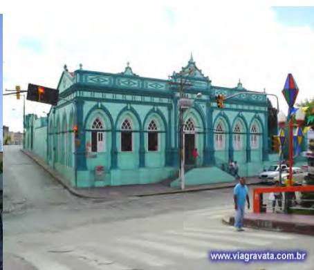
F.6. Fotografia do Memorial e Biblioteca Pública e F.7. Prefeitura Municipal de Gravatá.