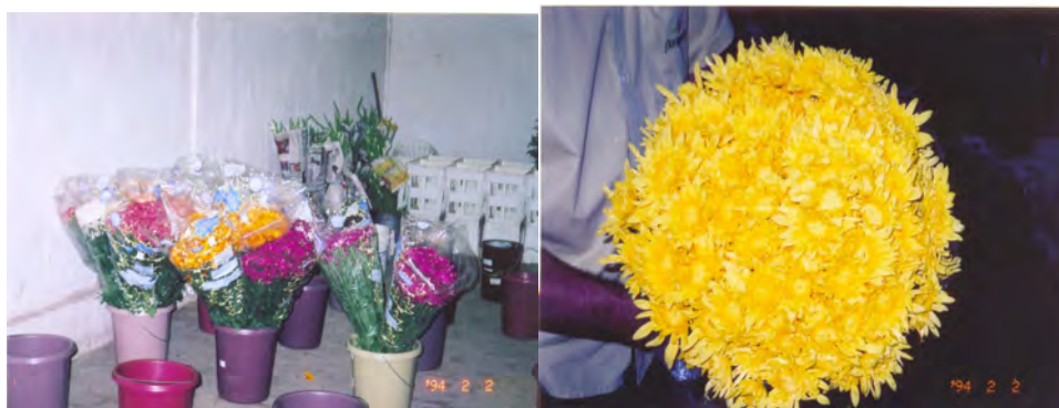
F. 55. Fotografia das Flores em Pacotes e F.56. Fotografia do Buquet de Flores . Acervo Pessoal da Pesquisadora em 22/06/2006.