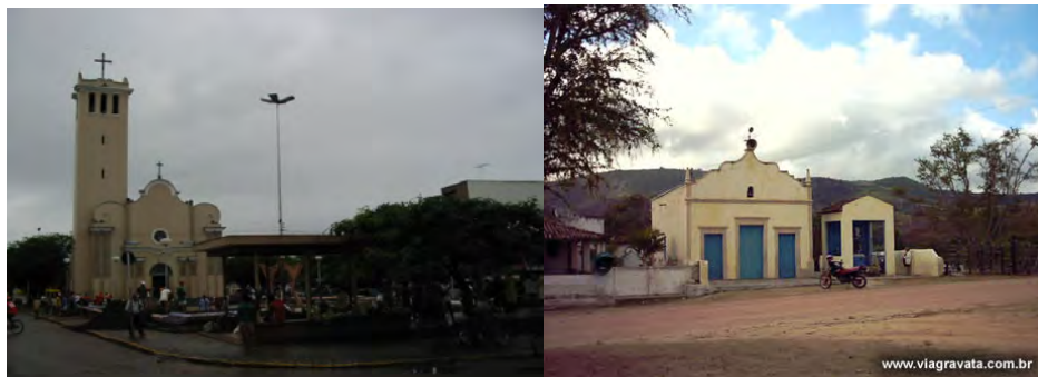
F.4. Fotografia Igreja Matriz de Sant'Ana no Centro de Gravatá. e F.5. Fotografia da Capela São Miguel.