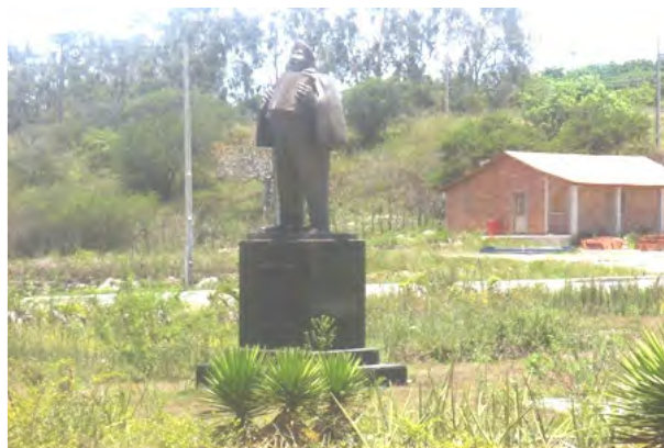
F.10. Fotografia da Rodovia Luiz Gonzaga, BR 232 - Eixo de entrada no Município de Gravatá.