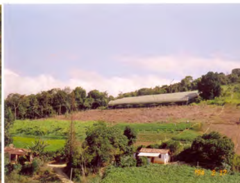
F.49. Plantação de repolho da agricultura tradicional. E F.50. Fotografia da Agricultura Tradicional e Estufa de Flores.