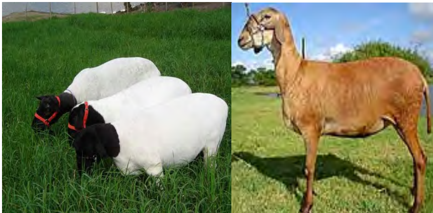
F.62. Fotografia da ovelha da raça Dorper e F.63. Fotografia da ovelha da raça Santa Inês. Fonte: Rebanho Carootá. Disponível em: http://www.caroota.com.br . Acesso em 30/05/2007.