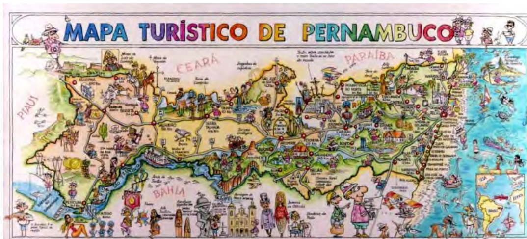
F. 68. Mapa Turístico de Pernambuco. Fonte. EMPETUR. Inventário Turístico de Pernambuco, 2004.