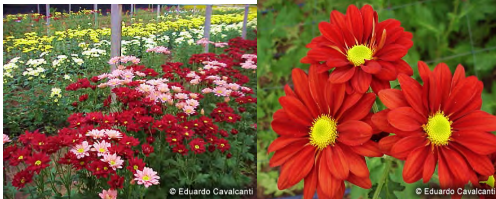
F. 57. e F. 58. Fotografias de Gérberas cultivadas em estufas. Em 15/12/2005.