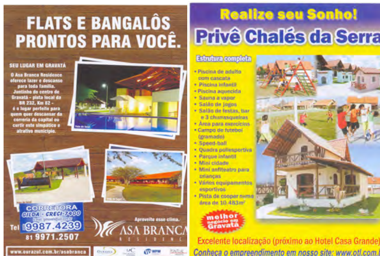
F.44. Panfleto de propaganda do “Resort” Condomínio Asa Branca, e F. 45. Panfleto de propaganda do Prive Chalés da Serra. Acervo pessoal da Pesquisadora em 20/12/2005.