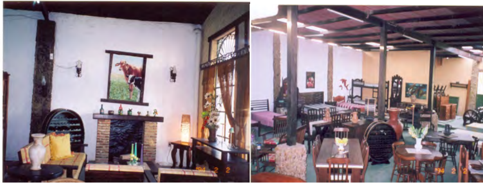
F.17. e F.18. Fotografias de uma loja de Móveis em Gravatá.