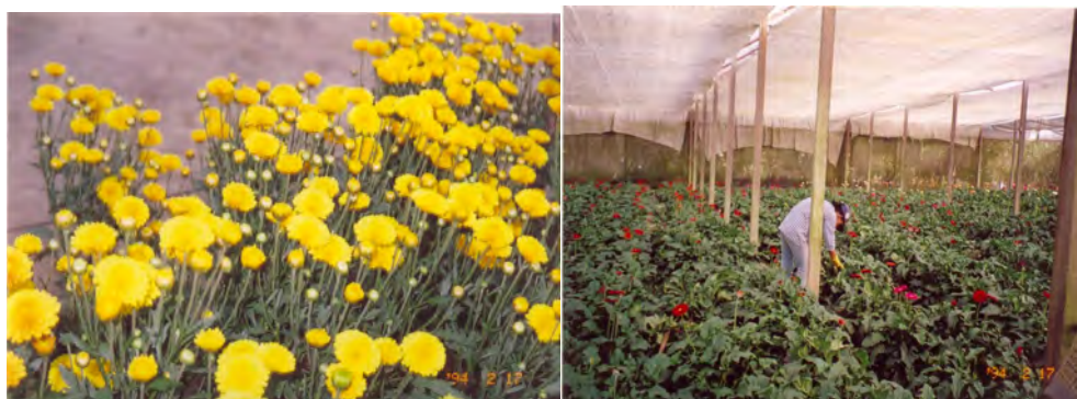
F. 53. e 54. Fotografias das Flores Cultivadas em Estufas. Acervo Pessoal da Pesquisadora em 22/06/2006.