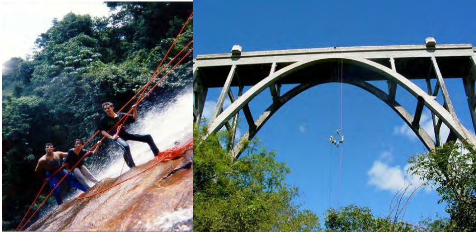
F. 41. Fotografia - Esportes Radicais na Cachoeira e F. 42. Fotografia - Esportes Radicais no Túnel Cascavel.