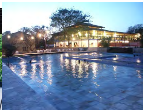
F.29. Fotografia da Recepção do Hotel-Fazenda Portal de Gravatá. e F. 30. Fotografia do Restaurante do Hotel-Fazenda Portal de Gravatá.