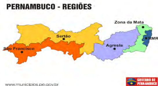
F. 1. Mapa do Estado de Pernambuco, por Regiões. Fonte: Governo do Estado de Pernambuco. Disponível em: www.municipios.pe.gov.br , Acesso em: 20/05/2005.

Antes de entrarmos na história de Gravatá, gostaríamos de ressaltar que a ocupação do território pernambucano teve como eixo norteador a cultura canavieira, em toda a área litorânea e das Zonas da Mata Norte e Mata Sul.