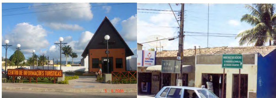
F.37. Fotografia do Centro de Informações Turísticas de Gravatá, e F.38. Fotografia da Placa de Sinalização.