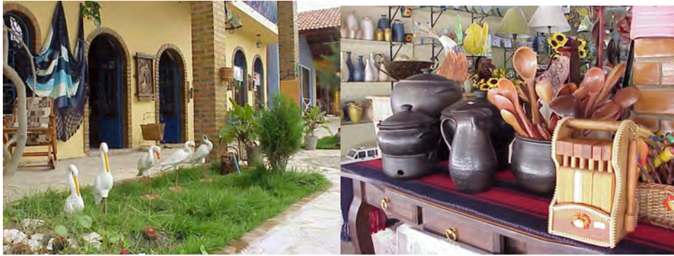
F.11. Fotografia do Pólo Moveleiro de Gravatá. Fonte: Acervo Pessoal da Pesquisadora em 23/12/2005, e F.12. Fotografia do Artesanato em Barro em Madeira. Fonte: Prefeitura de Gravata. Disponível em: http://www.prefeituradegravata.com.br . Acesso em: 15/12/2005.