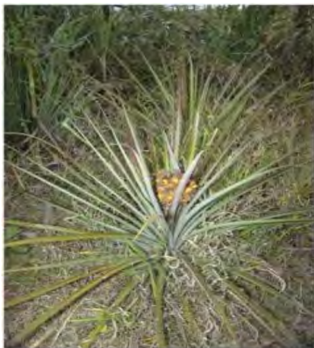
F.3. Fotografia Bromélia Karatas ou Gravatá.