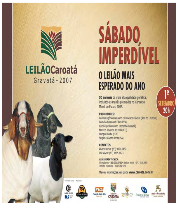
F. 64. Cartaz do I Leilão Carotá 2007 em Gravatá.