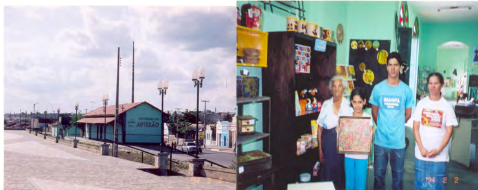
F.15. Fotografia da Casa do Artesão e F.16. Fotografia dos Artesãos. Fonte: Acervo Pessoal da Pesquisadora em 15/01/2006.