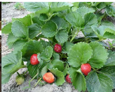
F.47. Fotografia do Mercado Público reformado. F. 48. Fotografia da plantação de Morangos. Fonte: Prefeitura de Gravataí. Disponível em: http://www.prefeituradegravatá.com.br . Acesso em 11/05/2007.