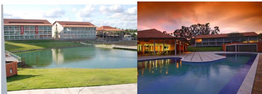
F.27. Fotografia do Hotel Vila Hípica em Construção e F. 28. Fotografia Restaurante do Flat Vila Hípica.