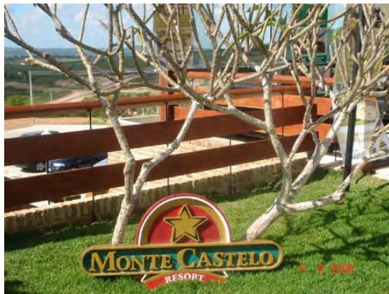
F.46. Fotografia do “Resort” Condomínio Monte Castelo.