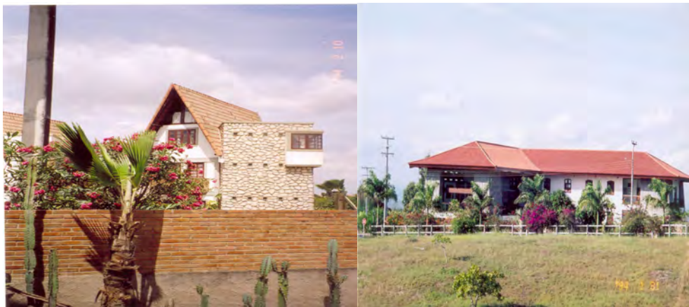
F.21. Fotografia do Privê Mapuquara em Gravatá, e F.22. Fotografia de Condomínio Asa Branca.