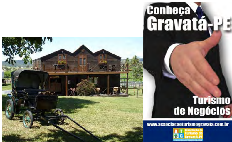
F.35. Fotografia do Haras das Acácias, e F. 36. Folder da Associação de Turismo de Gravatá.