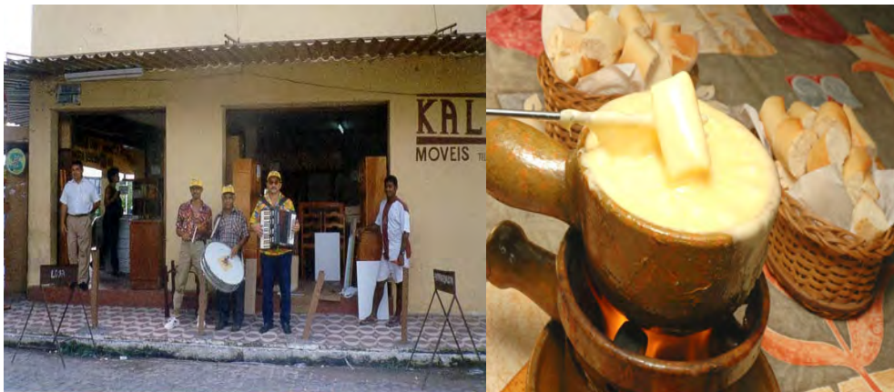
F.19. Fotografia de um Grupo de Forró de Pé de Serra e F.20. Fotografia do Fondue gravataense.