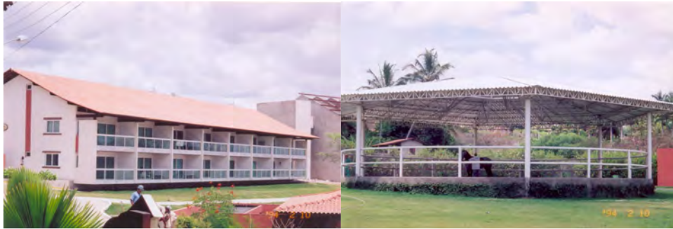
F.23. Fotografia do Apart-hotel Vila Hípica e F.24. Fotografia do Redondel do Centro Hípico Vila Hípica. 18/06/2006.