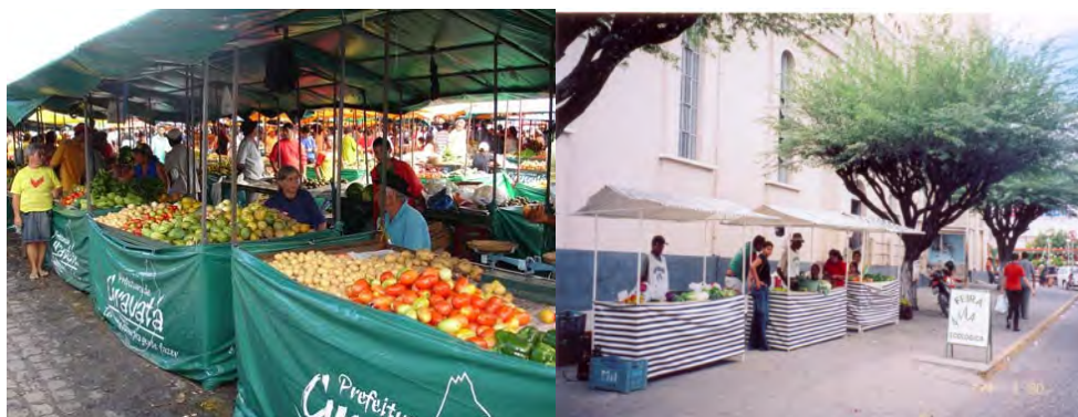
F.51. Fotografia das Barracas da Feira Livre. Fonte: Prefeitura de Gravatá. Disponível em: http://www.prefeituradegravata.com.br . Acesso em 15/12/2005, e F.52. Fotografia das Barracas da Feira de Produtos Orgânicos. Acervo pessoal da Pesquisadora em 22/12/2006.