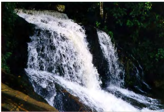
F. 43. Fotografia da Cachoeira da Palmeira. Fonte: Prefeitura de Gravatá. Disponível em http://www.prefeituragravata.com.br . Acesso em: 21/03/2005.