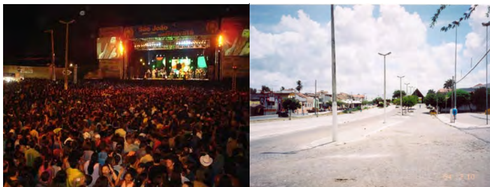
F.39. Fotografia do Show no Palco do Pátio de Eventos. Fonte: Prefeitura de Gravatá. Disponível em: http://www.prefeituradegravata.com.br . Acesso em: 21/03/2007. E F.40. Fotografia da Área do Pátio de Evento. Fonte: Acervo Pessoal da Pesquisadora em 18/06/2006.