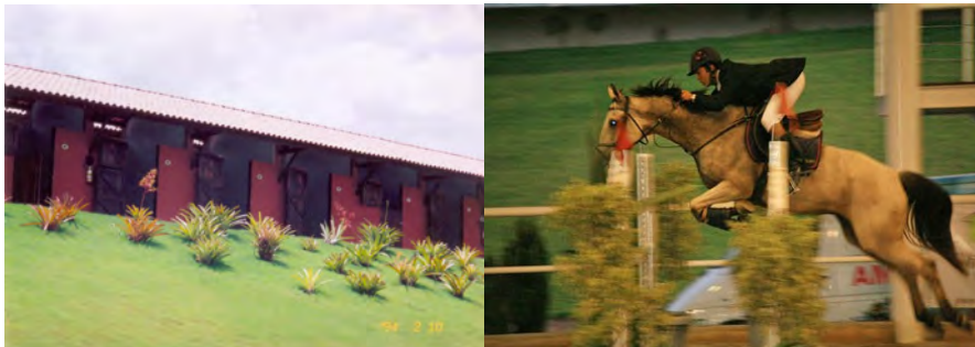
F.25 Fotografia das Baidas no Centro Hípico. e F. 26. Fotografia do Treinamento de Salto no Centro Hípico.