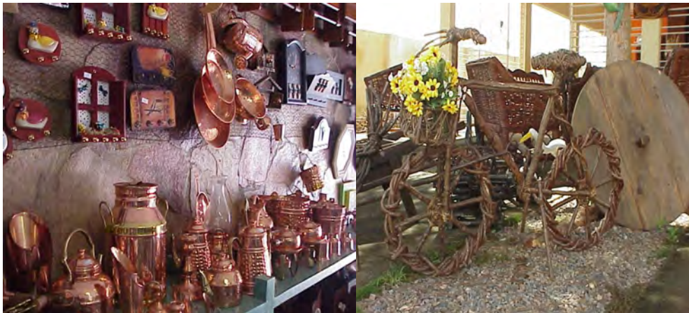
F.13. Fotografia do Artesanato em Bronze e F.14. Fotografia do Artesanato em Trançado.