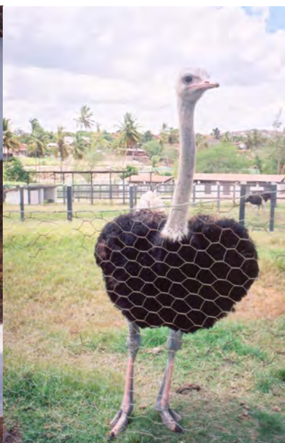
F.33. Fotografia do Mini-boi e F.34. Fotografia do Avestruz no Haras Vale das Acácias.