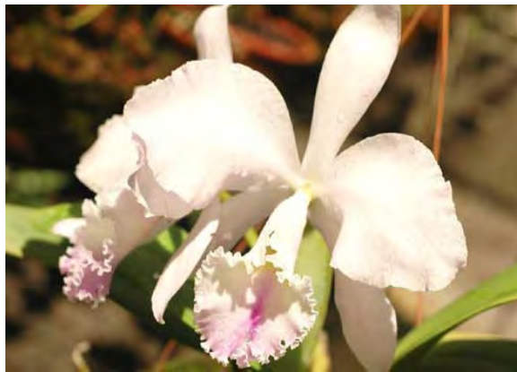
F.59. Fotografia de Orquídea. Fonte: Prefeitura de Gravata. Disponível em http://www.prefeituradegravata.com.br . Acesso em 30/05/2007.