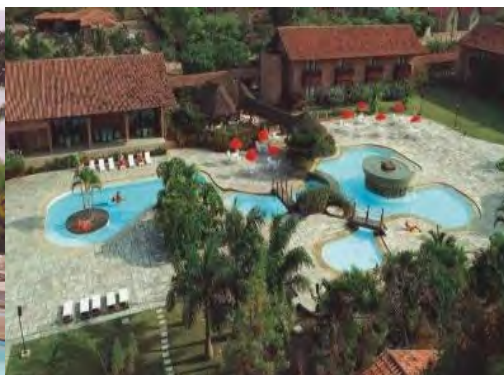
F.31 Fotografia da Recepção do Hotel Casa Grande. Fonte: Acervo Pessoal da Pesquisadora em 22/06/2006 e F.32. Fotografia do Parque Aquático do Hotel Casa Grande. Fonte: Hotel Casa Grande. Disponível em: http://www.hotelcasagrandegravata.com.br . Acesso em: 21/03/2007.