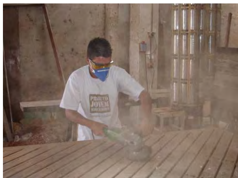
F.67. Fotografia da Capacitação Profissional de Jovens em Marcenaria. Disponível em: http://www.prefeituragravatá.com.br . Acesso em: 30/05/2007.