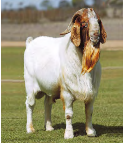
F.61. Fotografia do Bode Bôer, “Super Boy”.