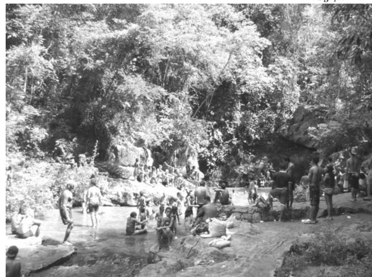
As cachoeiras são muito procuradas. Durante o verão, cerca de 15 mil pessoas visitam o Parque Municipal

A Secretaria municipal de Meio Ambiente de Agricultura irá investir R$ 1 milhão e 420 mil em obras de melhorias no Parque Natural Municipal de Nova Iguaçu. Os recursos foram liberados pela Câmara de Compensação da Secretaria de Estado do Ambiente. O projeto começa a ser elaborado em junho e, após a licitação, iniciam-se as obras. O parque ganhará ainda uma picape (cabine dupla), uma motocicleta e um quadriciclo, que serão utilizados no serviço de vigilância.