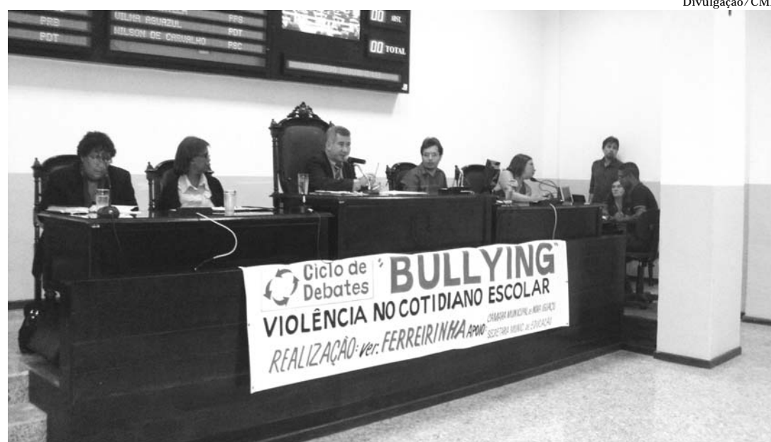
O bullying foi tema de debate na Câmara Municipal de Nova Iguaçu na última quinta-feira, dia 26