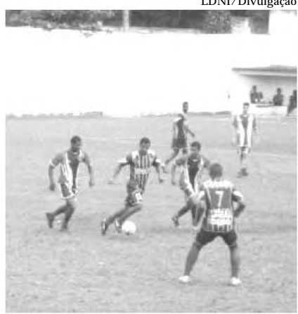
Linave e Barros entram em campo para a grande final em igualdade de condições, um empate leva a disputa para os pênaltis

O Barros também já conquistou três títulos do Iguaquano, em 1996 diante do XV de Novembro vencendo por 2 a 1, levou o bi em 1997 após derrotar o Esperança por 1 a 0, e em 2000 conquistou seu terceiro título