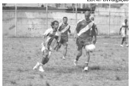
Neste domingo, dia 5, é a grande final da categoria Master, entre Morro Agudo e Palmares

O Morro Agudo FC por sua vez quer mais um título no Master e conquistar a tríplice coroa em 2010, porque já foi campeão do Torneio de Verão e da Taça Cidade de Nova Iguaçu. Com um elenco recheado de