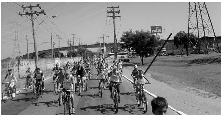
O II Pedala Nova Iguaçu está confirmado para o mês de agosto, mais precisamente no dia 29

Será no dia 29 de agosto, a segunda edição do Pedala Nova Iguaçu, que tem como objetivo incentivar ainda mais o uso da bicicleta na Baixada Fluminense. Dessa vez serão 10 km, com largada e chegada na Praça do Cajueiro (próximo à Mavesa), no bairro da Vila Nova. O passeio ciclístico Urbano passará por vários bairros de centro da cidade e grande parte do trajeto será pela Via Light e poderão participar todos entre 10 e 80 anos.