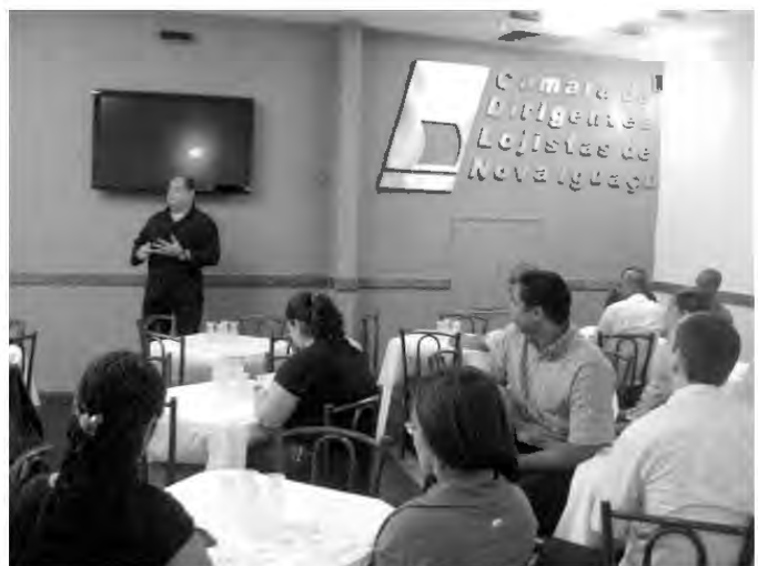
O 67º Almoço interativo da CDL-NI foi marcado pela alegria e satisfação em melhorar cada vez mais, na vida profissional e também na vida pessoal

A CDL de Nova Iguaçu promoveu nessa última sexta-feira uma reunião com 13 presidentes de CDL's da região metropolitana do Estado do Rio de Janeiro, visando o desenvolvimento Econômico e Social das cidades da região.