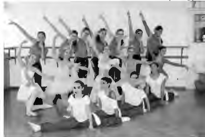
A Cia. de Dança do IESA é formada por meninas entre 8 e 16 anos

O grupo de bailarinas do Instituto de Educação Santo Antônio (IESA) foi um dos destaques da sétima edição do Festival Nacional de Paraty, que é uma das principais competições nacionais reunindo centenas de bailarinos de todo o país.