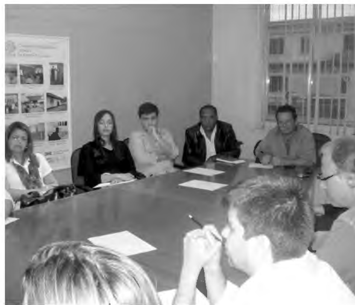
Secretários de Saúde e representantes municipais aprovam permanência da central em Nova Iguaçu

Aprovar o projeto de reforma e ampliação da central Samu Baixada foi a principal pauta da reunião extraordinária do Conselho Técnico e do Colegiado de Gestão Regional, ocorrida no final de junho, na sede do Consórcio Intermunicipal de Saúde da Baixada Fluminense - Cisbaf. Uma planilha detalhada foi apresentada aos secretários pelo consórcio com os custos necessários para a execução do projeto, que inclui aquisição de equipamentos e mobiliário para a nova central de regulação do Serviço Móvel de Urgência e Emergência. Foi unânime a decisão dos secretários e representantes para a manutenção da sede da central no município de Nova Iguaçu, tendo em vista que os estudos preliminares demonstraram que os recursos a serem liberados pelo Ministério da Saúde, na ordem de R$ 175 mil, serão suficientes.