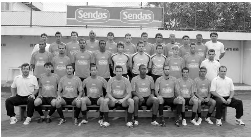
Equipe campeã da Série C em 2007