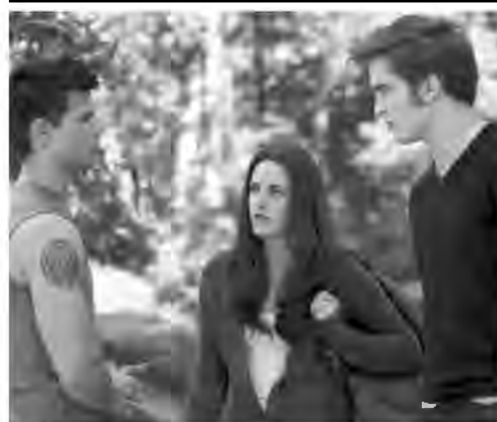
O filme Eclipse está em cartaz no Iguaçu Top 2

Grupo Severiano Ribeiro – Iguaçu TopShopping – Telefone: 2461-2461