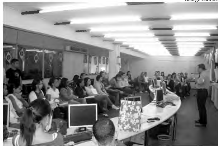
Há três semanas a rotina dos funcionários da Semef mudou

A Prefeitura de Nova Iguaçu está promovendo entre os servidores da Secretaria Municipal de Economia e Finanças uma nova maneira de encarar as atribuições públicas. Desde o último dia 17, cerca de 80 funcionários que lidam diretamente com a população participam do primeiro módulo da oficina de atualização de profissionais. A ideia transformou auditores fiscais do município em professores, que se revezam às terças e quintas-feiras para darem aulas de noções tributárias, atendimento e até história da Baixada. O curso, que possui oito módulos, terá a duração de três meses.