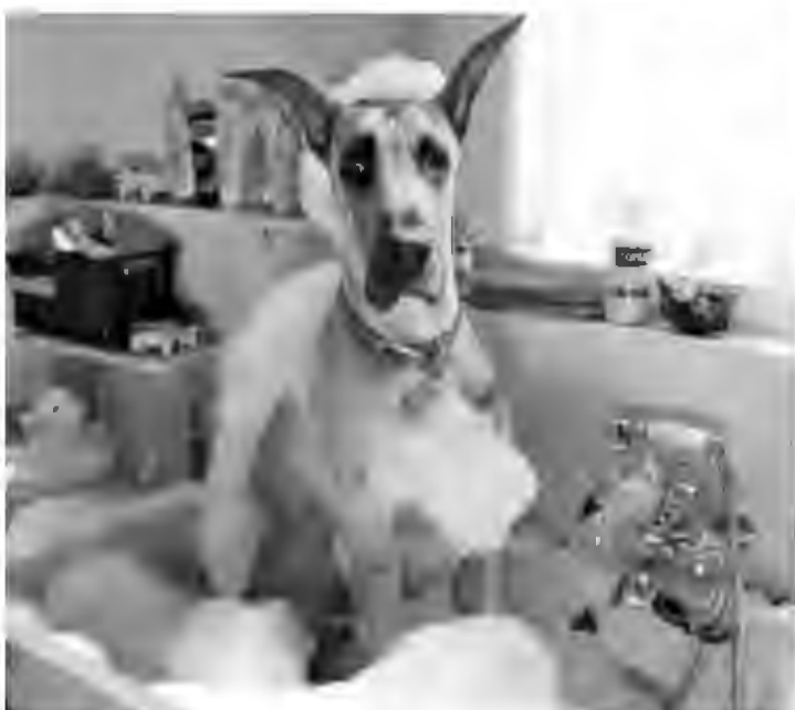
O filme "Marmaduke" está em cartaz no Iguaçu Top 1

Grupo Severiano Ribeiro – Iguaçu Top Shopping – Telefone: 2461-2461