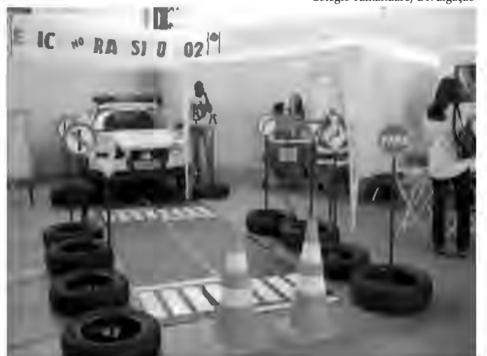
Alunos montaram uma pista de trânsito com material reciclado

Sábado passado os alunos do colégio Tamandaré de Nova Iguaçu tomaram o lugar dos professores para dar uma aula de cidadania. Utilizando diferentes áreas do conhecimento, a garotada usou e abusou da criatividade para falar sobre ética.