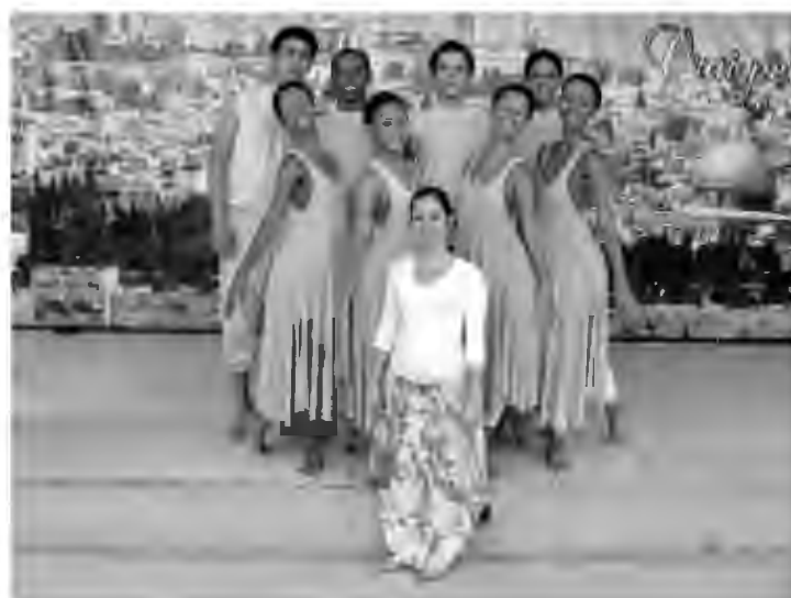
Escola de Dança Novos Passos Nova Iguaçu

Com patrocínio do Fundo Municipal de Cultura Antonio Fraga, a Prefeitura de Nova Iguaçu promove a I Mostra de Dança Gospel de Nova Iguaçu. O evento acontece neste sábado, dia 5, às 15h, na sede da Comunidade Evangélica Sarando a Terra Ferida – Rua São Pedro, nº 12, Miguel Couto. O ingresso custa R$ 2 mais um quilo de alimento não perecível.