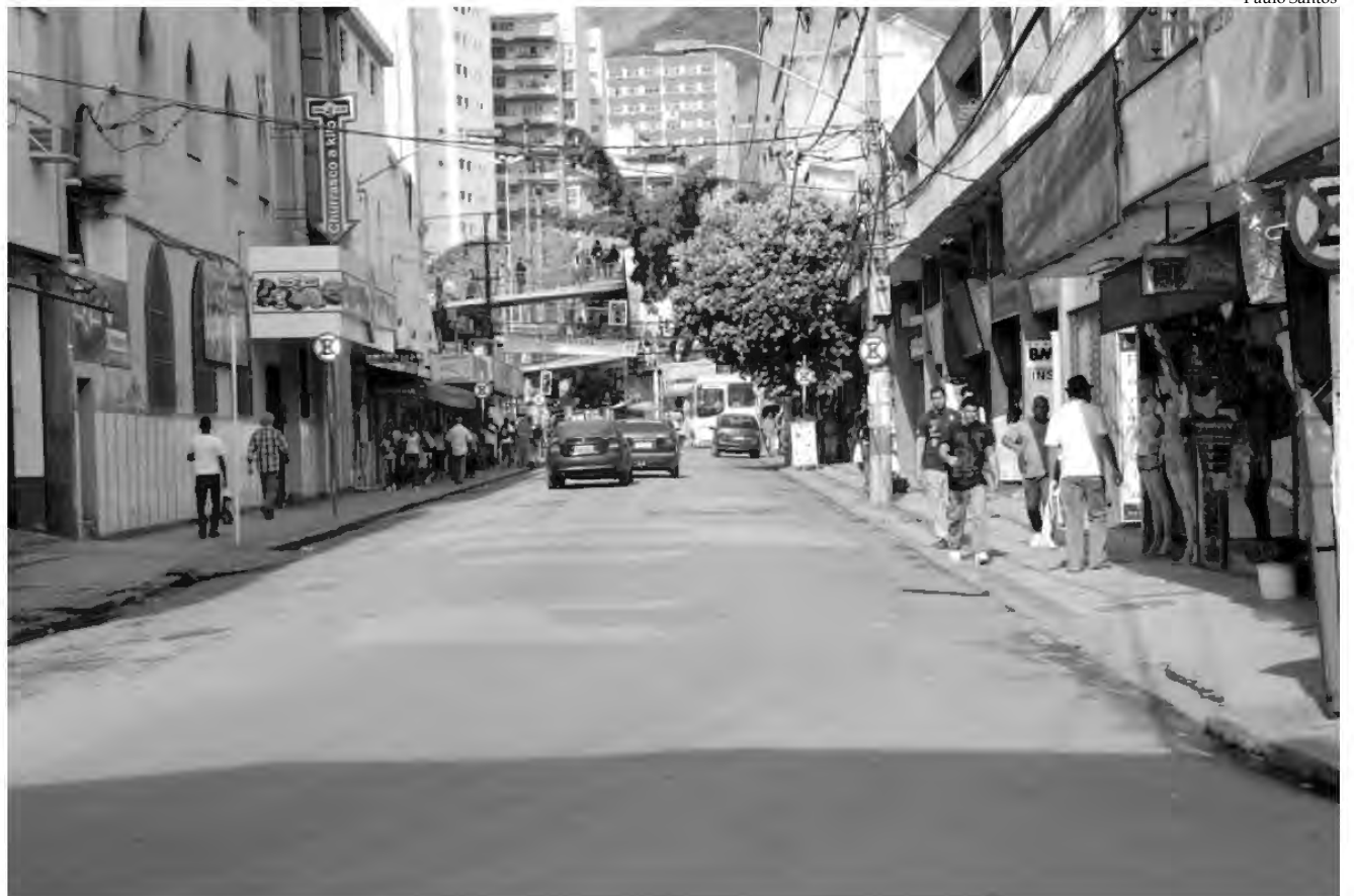
A iniciativa da Prefeitura, a partir do dia 1º, de abrir caminho em algumas ruas com a eliminação do “vaga certa”, contou com a aprovação dos principais lojistas estabelecidos no centro comercial da cidade

As mudanças que estão sendo praticadas pela Prefeitura de Nova Iguaçu ainda não geraram tantas melhorias mas já são sentidas pelos pedestres. (Continua na pág. 2)