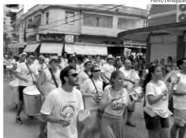
O bloco Xurréia Cabeluda agitou as ruas do centro em 2009 e volta em 2010

A pouco mais de 15 dias para o início do Carnaval, os desfiles de blocos são como abre-alas para os foliões entrarem no clima da festa popular mais esperada do ano, esquentando os tamborins e embalando o público pelos bairros da cidade com as tradicionais marchinhas de carnaval. Quarto colocado em 2009, o Bloco Xurréia Cabeluda desfilará pelo segundo ano consecutivo. A concentração é na Praça do Skate, Centro de Nova Iguaçu. O percurso, estimado em três horas, passará pelas principais ruas do centro como as avenidas Mário Guimarães e Abílio Au-