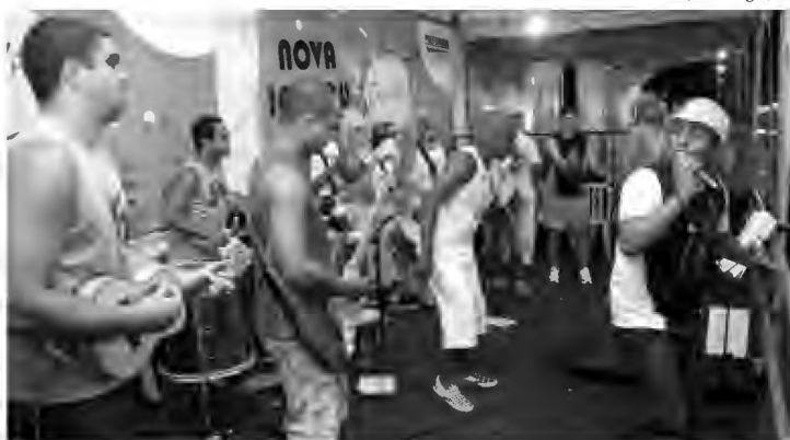
Trio Elétrico Bloco 18