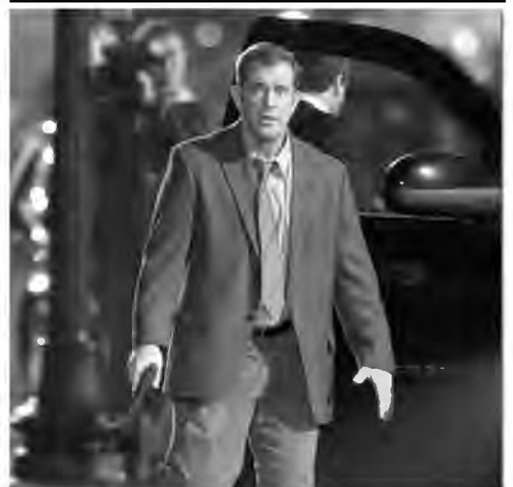
O filme "O fim da escuridão" está em cartaz no Iguaçu Top 2

Grupo Severiano Ribeiro - Iguaçu Top Shopping - Telefone: 2461-2461