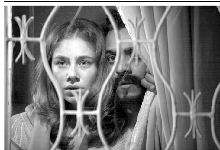
O filme “Lula, o filho do Brasil” está em cartaz no Iguaçu Top 3

Grupo Severiano Ribeiro – Iguaçu Top Shopping – Telefone: 2461-2461