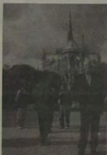
Uma vista da Catedral Notre-Dame de Paris