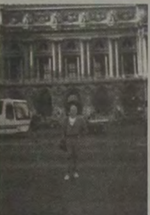
A Opéra National de Paris-Garnier, na Place de l'Opéra