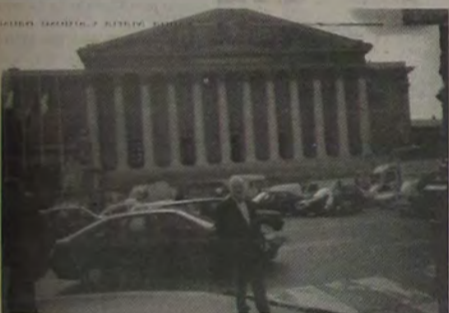
Em frente a Assembléia Nacional