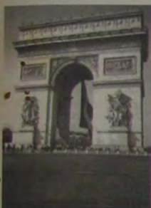
O famoso Arc de Triomphe, na Place Charles de Gaulle, na Champs-Elysees