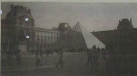
O Musée e Pyramide du Louvre. Mas não deixem de visitar o Palais de la Découverte, Musée du Petit Palais, Musée de l'Orangerie des Tuileries, no bellissimo Jardim de Tuileries, vale a pena, assim como uma passada no Musée National Auguste Rodin, Musée d'Orsay, Musée de la Monnaie e, claro, Musée National d'Art et Culture Georges Pompidou