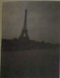
A Torre Eiffel vista do Rio Sena, onde se pode visitar a cidade através dos Bateaux-Mouches ancorados ao largo da Pont de l'Alma, Pont d'Alma, Canal Saint-Martin, Port de Suffren, Canal de l'Ourcq and canal Saint-Denis e mais e mais...

Paris é destaque maior neste sábado. Irio visitou a Cidade Luz e clicou os melhores movimentos, monumentos, lugares históricos, um rodópio básico de quem vai para a França. Paris para vocês também!