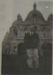
Irio em frente a Basílica Sacré Coeur. Para chegar lá basta pegar o metrô Anvers, Abbesses e... pronto. Neste verão, abre as nove da manhã e fica aberta a visitação até onze da noite!