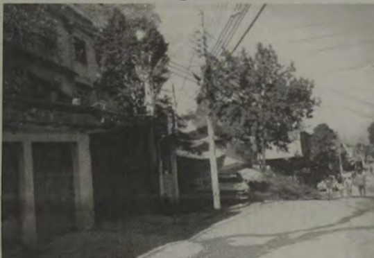
A Rua Pau Brasil, uma das principais da Vila São Teodoro, encontra-se em estado lastimável.