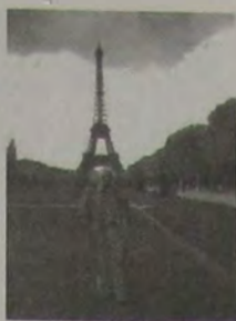
No Champs de Mars, tendo ao fundo toda a maravilha que é a Torre Eiffel