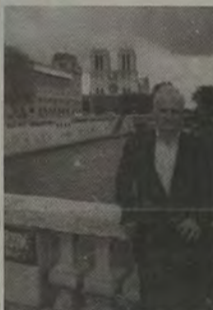
Outra vista da Catedral Notre-Dame, ao lado do Rio Sena