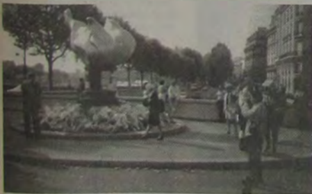
A Pont d'Alma, onde morreu Lady Diana e no local - hoje uma atração turística - um monumento, como podem ver na foto