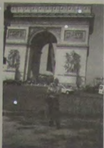
Mais um ângulo do Arc de Triomphe