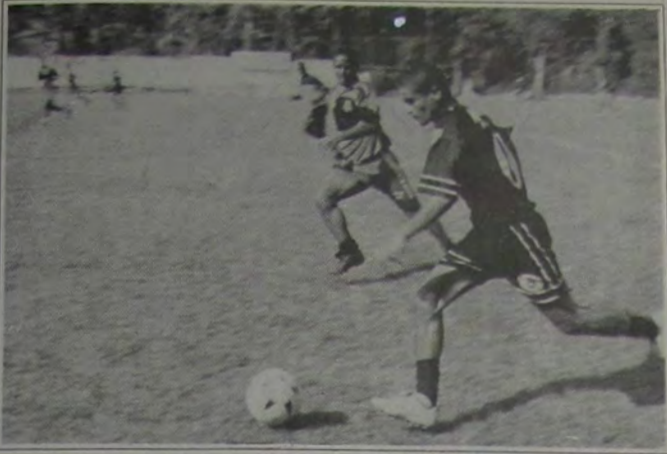
Para, um dos destaques do time do Brazilian Boys

No próximo domingo, dia 3 de fevereiro, acontece a 4ª rodada do Torneio de Verão/2002, promovido pela Liga de Esportes de Nova Iguaçu, que tem a participação de 48 clubes. Miguel Couto x Breda Rio fazem o principal jogo da rodada, que será realizado às 16 horas, no Estádio Silveirão, no Bairro de Iguaçu Velho, em Vila de Cava.