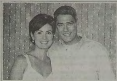
Fátima Bernardes e William Bonner, o casal virte da TV brasileira