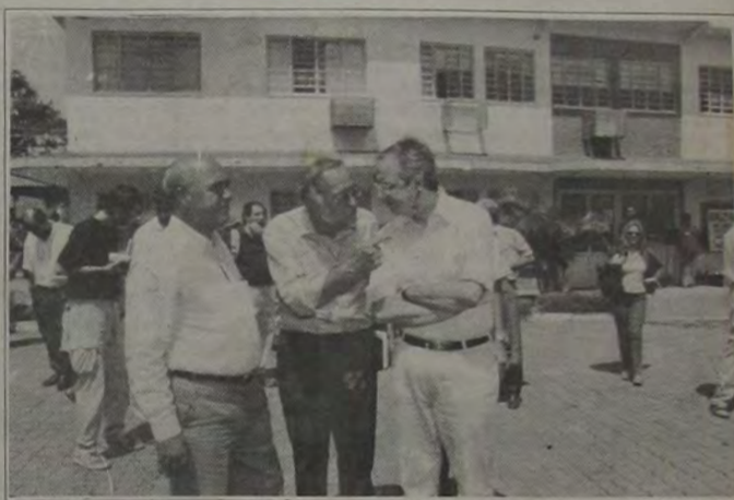
Bornier, o Padre Renato Chiera e o prefeito de Roma, Valter Veltroni

Nelson Bornier encerrou a cerimônia agradecendo a visita de Valter Veltroni e declarou que a transformação das condições da criança depende de uma vontade suprapartidária de mudar esse quadro. "As mudanças acontecem com as parcerias de fora e dentro do Brasil. É um privilégio ter aqui uma das mais importantes figuras políticas da Itália. A miséria ultrapassa os limites geográficos de estados e países. So com união poderemos resolver esse problema", concluiu Bornier.