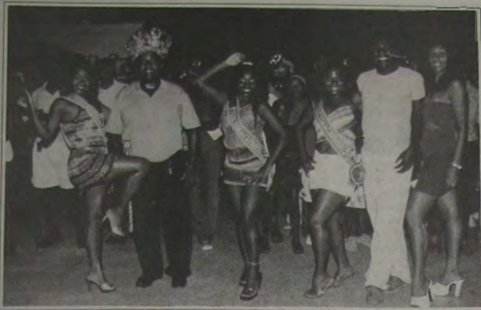
A Corte Momesca, em recente visita a Escola de Samba Leão de Nova Iguaçu

Praça de Alimentação: A Praça, com cerca de 630m², está reservando um espaço para cerca de 60 barraqueiros. A taxa é de R$ 279,74 por uma área de 3x3m pelos cinco dias de folia. A inscrição pode ser feita no Departamento de Fiscalização da Prefeitura, a Rua Zelina Pinto, 36, Centro (ao lado do Banco do Brasil). Queimados, de segunda a sexta, das 8 às 17 horas. Maior informações pelo tel. 2665-4242.