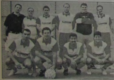
A equipe da Chave Fluminense de futsal adulto.