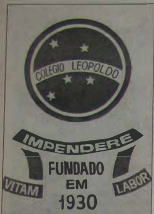
O símbolo do Colégio Leopoldo