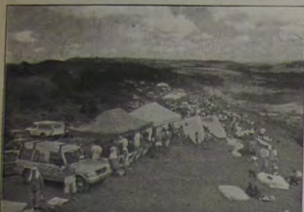
Aspecto geral do campeonato dos pilotos que participaram da II Etapa do Circuito Brasileiro de Paraglyder, em Cambuquira (MG).

Quem conhece a região do Vale do Paraíba, da Serra da Mantiqueira e algumas cidades do famoso circuito das Águas, certamente já ouviu falar da pacata cidade de Cambuquira, que encantou o mundo nos anos 50 e 60 pelos seus parques de águas minerais e principalmente pelos seus cassinos que atraíram aventureiros do Triângulo Mineiro em busca de riquezas. Cambuquira está encravada num belo vale a poucos quilômetros da famosa e mística São Tomé das Letras, de Caxambu e de São Lourenço. Cambuquira é privilegiada pela altitude, mais elevada que suas vizinhas e também se orgulha de suas fontes hidrominerais eleitas pela revista VIP EXAME com a seguinte definição: "Vem de Cambuquira, Sul de Minas, a melhor água mineral do Brasil e a segunda melhor do mundo".