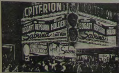
Estréia de "Sabrina", filme de 1954, do consagrado estilista Billy Wilder, cineasta de origem austríaca que brilhou intensamente em Hollywood. Aqui revela-se o fascínio do cinema sobre as grandes multidões. Barreiras de policiais eram formadas para impedir o contato do público com seus ídolos. Eis aí a prova irrefutável da força do cinema como elemento catártico que atinge as grandes massas.

No Brasil, o Oscar parece ofuscar a visão de nossos cineastas. Nos últimos anos, a maioria deles está mais preocupada em ganhar a estatueta do que fazer filmes para o público brasileiro. O cinema nacional tem uma história significativa. Não precisa do Oscar. Nosso cinema tem que mostrar nossa realidade para o nosso público e brigar contra a invasão do cinema internacional. Tivemos nosso pioneirismo, tivemos um cinema popular com as chanchadas. Tivemos o Cinema Novo, consagrado e respeitado, principalmente na Europa. E Oscar por Oscar, nós temos o nosso eterno Oscanto.