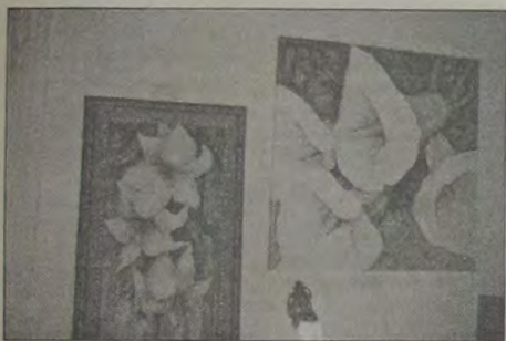
Dois trabalhos de Elvira