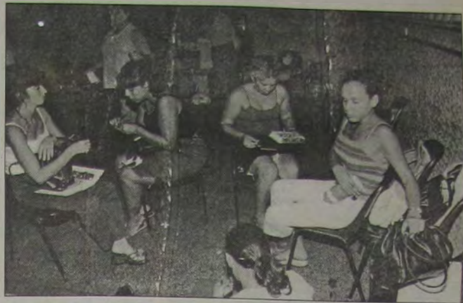
Professoras que participam do curso A reflexão-ação do Professor na Educação Infantil, reunidas no Colégio Municipal Monteiro Lobato