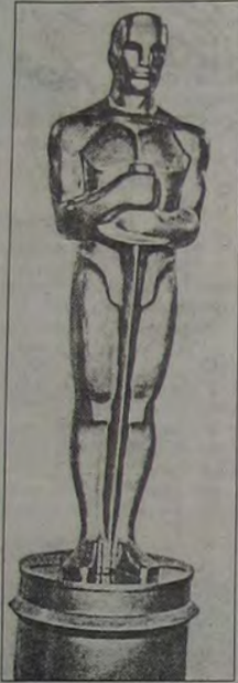
O Oscar - premiação máxima da cultura cinematográfica norte-americana. Feito basicamente de estanho e banhado a ouro 14 quilates. Mede 34,29 cms e passou a simbolizar, sobretudo nas três últimas décadas, a supremacia do poder econômico sobre o valor artístico.