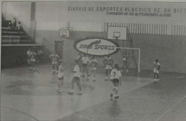
As meninas do IBC venceram com facilidade o Combinado da Baixada.

Fácil, extremamente fácil para as meninas do handebol do IBC o jogo contra o Combinado da Baixada dirigido pelo Prof. Junior. O placar da primeira etapa foi 16 a 9 para o IBC.