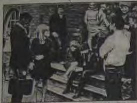
Cena de "Aos mestres com carinho", com Sidney Poitier.

O cinema, em sua trajetória, tem realizado filmes em que o personagem principal é o professor. Alguns deles ficaram marcados em nossa memória. É