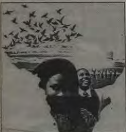
Cartaz promocional do filme "Sarafina", estrelado por Whoopy Goldberg.

pousa nas cabeças dos jovens rebeldes, levando a luz da sabedoria e do conhecimento. O poder inovador dos mestres, mostrando as verdades e as mentiras do próprio homem, onde um novo mundo é revelado, está em "Sarafina - O Som da Liberdade" (Sarafina, 93), onde Whoopy Goldberg é uma professora revolucionária, que desafia o sistema discriminatório da África do Sul, ensinando a verdadeira História de sua raça, com lições proibidas que causam impacto nos jovens e principalmente em Sarafina. Boa direção de Darrel James Roodt.