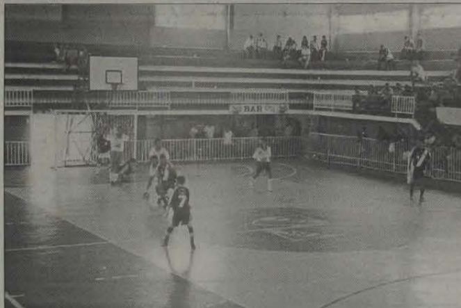
A Seleção Iguaçuana jogou bem, na partida em que derrotou o Vasco da Gama por 6 a 4.

O futsal iguaçuano mostrou a sua força contra a renomada equipe infantil do Vasco da Gama, em amistoso realizado nesta última quinta, dia 12, às 12 horas, no Iguaçu Basquete Clube (IBC).