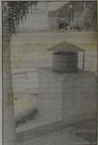
A chaminé por onde se dá a exaustão do forno de tratamento do lixo fica no interior da área murada que dá para a Rua Athaide Pimenta de Moraes.

Todas as pessoas que passam na Rua Pimenta de Moraes, sentem um forte mau cheiro que vem exalando do setor de tratamento de lixo do Top Shopping. Os taxistas que fazem ponto no local e os moradores próximos são os que mais sofrem com o problema. O mau cheiro é tanto que chega a causar náuseas, vômitos e ardência nos olhos de quem passa por ali.