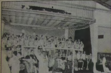
Os alunos vibraram durante todo o tempo, constituindo vibrante torcida dos times que disputaram o Torneio.

Sexta-feira da semana passada, dia 29, o Colégio Luiz Silva, seguindo a sua política de promover, cada vez mais, a integração da comunidade escolar de Comendador Soares, promoveu um disputadíssimo Torneio Inter-Escolar de Futsal, do qual participaram o próprio estabelecimento promotor do evento esportivo e mais as escolas Boa Esperança, Menino Jesus, Comendador Soares, R.S.E. Menezes I, R.S.E. Menezes II e o Ibéria (time de ex-alunos), que foram divididas em quatro chaves - A, B, C e D. A final foi decidida entre o Luiz Silva e o R.S.E. Menezes I, o primeiro vencedor do grupo A-B e o segundo do grupo C-D. Sagrou-se campeão o Colégio Luiz Silva A-B, em partida que entusiasmou e fez vibrar o grande número de torcedores - alunos e familiares - que lotou o ginásio do Colégio Luiz Silva.