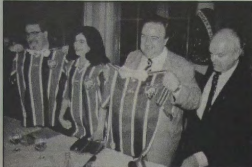
Primeira-dama Rosinha Matheus, Prefeito carioca Luiz Paulo Conde e Ministro do Turismo Rafael Greca, em festa no Fluminense.

Entre as Personalidades 2000 da grande festa de setembro, a lista das 10 Mais do Século, que já está pronta. O que? Vocês querem saber os nomes? Depois eu conto.