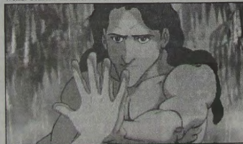
"Tarzan": nova produção da Disney.

□ IGUAÇU TOP 3 - "A múmia" (5ª semana), com Brendan Fraser e Rachel Weisz. Censura: 12 anos. Horário: 13h20m - 15h20m - 18h20m e 20h20m.