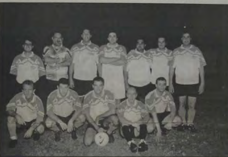
A equipe do Boca Juniors/Nova Rical, que veio atropelando por fora sem que os outros percebessem, acabou chegando às finais do Torneio da Amizade.