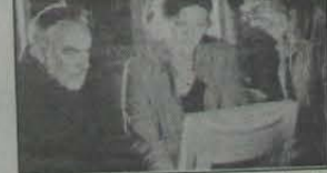
Os protagonistas Sean Connery e Catherine Zeta-Jones com o diretor Jon Amiel no set de filmagem de "Armadilha".

● IGUAÇU TOP 1 - "Matrix" (4ª semana). Com Keanu Reeves e Laurence Fishburne. Censura: 12 anos. Horário: 15h10m - 17h45m - e 20h20m.