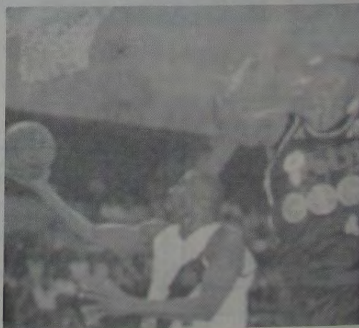
O Vasco da Gama está praticamente classificado para as finais do Campeonato Nacional.

O Estado do Rio deverá ter dois representantes nesta fase. Um já está praticamente classificado, que é o Vasco da Gama; o outro que ainda tem chances é o Flamengo, que chegou até mesmo a liderar a competição em sua fase inicial. No entanto, as sucessivas crises do clube da Gávea, que culminaram com a substituição do competente