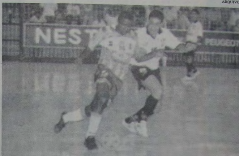
GM/Chevrolet e Corinthians na final do Paulistão/97.