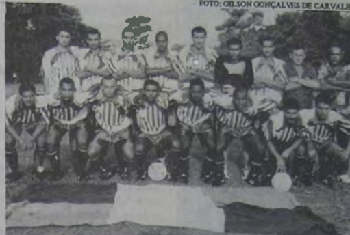
O tricolor da Zona Verde