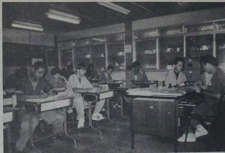
A alta qualidade da instrução técnica do SENAI tem sido a responsável pela qualificação de profissionais que se credenciam automaticamente para ingressar no mercado de trabalho.