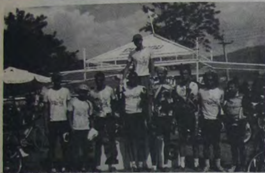
Os ciclistas do Mountain Bike que se destacaram no 2º Show de Esporte na Lagoa Azul.

Emoção, velocidade e muita adrenalina. Esta é a receita que a Secretaria de Cultura, Esporte e Lazer de Nova Iguaçu encontrou para transformar em sucesso o projeto "Show do Esporte".