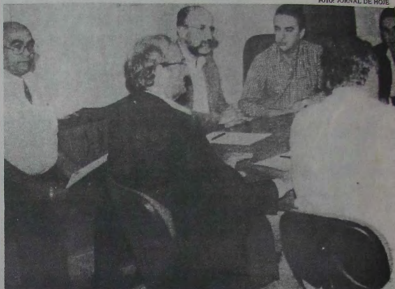
O encontro entre o vice-governador, Luiz Paulo Correia da Rocha, e os prefeitos da Baixada serviu para aprofundar a discussão dos principais problemas que afligem esta importante região do Estado do Rio.

Segundo o próprio vice-governador, o primeiro ponto discutido foi a concretização de uma parceria com o governo do Estado para a realização de obras de drenagem, pavimentação nos bairros mais carentes dos municípios, além da reativação da malha ferroviária.