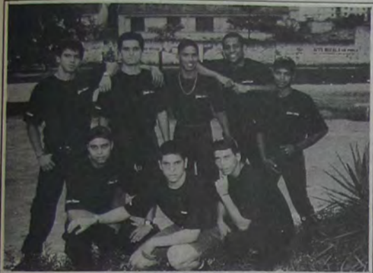
Turma jovem da banda Gente Nossa, que está fazendo imenso sucesso por todo o Brasil!