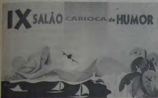
O cartaz do evento, criado por Lan

Foi inaugurado no dia 15 deste mês, o IX Salão Carioca de Humor, promovido pela Casa de Cultura Laura Alvim, em Ipanema. Neste ano foi adotado o tema mulher, daí o nome da mostra: "Rio Mulher", em sala especial. No traço de artistas como Ziraldo, Jaguar, Lan - o cartunista homenageado da exposição este ano -, todos os tipos de mulheres cariocas estão lá, engraçadamente retratados.