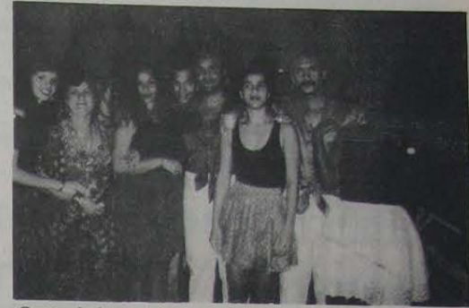
Grupo de dançarinos, a caráter.