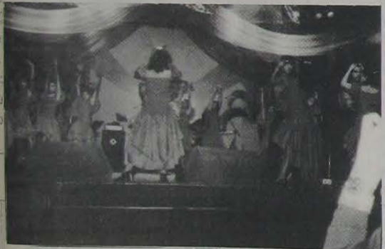
Academia Corpus, de Frago (Magé), espetáculo à parte.