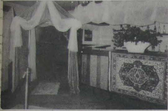
Bar da Riosampa, transformado em tenda cigana.