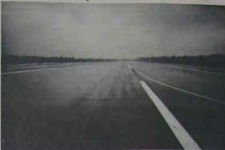
Com a inauguração da nova pista, de 1.200 metros de extensão, Nova Iguaçu entra, definitivamente, na rota da aviação comercial brasileira.

O novo programa de extensão da rede de abastecimento d'água, elaborado pela CEDAE (Cia. Estadual de Águas e Esgoto) para a Baixada, prevê a implantação de 95 Km. de novas tubulações. Acontece que só o município de Queimados não foi beneficiado com este programa, onde bairros, como Campo da Banha e Paraíso não veem uma gota d'água há muito tempo. "Mas todo mês nós recebemos a conta d'água", protestam justamente os moradores.