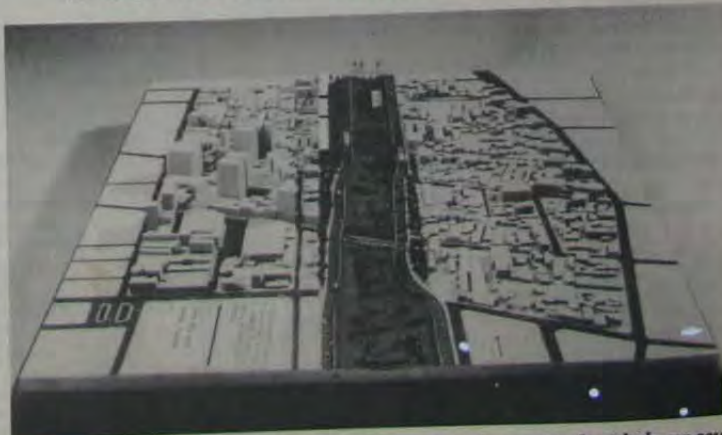
A maquete mostra o trecho da Via Light que cortará o centro da cidade, no seu polo comercial, do seu ponto de partida na Av. Gov. Roberto da Silveira até os limites da Cel. Francisco Soares. (Página 3)