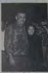
Casal Welney Rocha, em recente festa na city