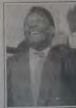
Pelé afirmou ter o desejo de ajudar estas crianças. Leia na página 1

Diante dos prefeitos da região, autoridades, políticos e empresários, o ministro Pelé anunciou a construção de seis vilas olímpicas na Baixada Fluminense que ao custo de cerca de 3,5 milhões deverá atender 50 mil crianças carentes. Para Pelé trata-se da realização de um sonho de 25 anos quando ao marcar e comemorar seu milésimo gol