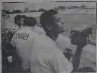
De cada um um, Jeffé trava para não ganhar. Belford, celebrando o Belford Roxo.

O torcedor da Baixada Fluminense é mesmo um privilegiado. Enquanto muitos estavam torcendo no último domingo pela Seleção Brasileira na Copa América, outros se concentravam na partida que estava acontecendo no Estádio José de Alencar, campo do Heliópolis, entre Belford Roxo e São Paulo, este de São João de Meriti. Com o empate em 0 a 0, o Belford