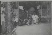
Barraca típica com drinks tropicais e afrodisíacos, um dos êxtos da festa