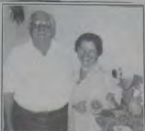
O casal anfitrião da bonita festa