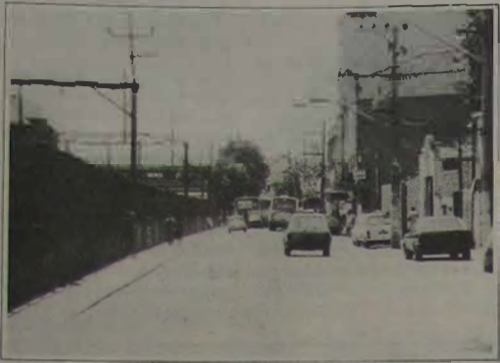
A retirada de ambulantes da Rua Bernardino de Mello, abriu espaço para a livre circulação dos pedestres.

A política de remanejamento até agora posta em prática pelos fiscais da SECIT tem se revelado eficiente e está sendo marcada pelo bom relacionamento entre os