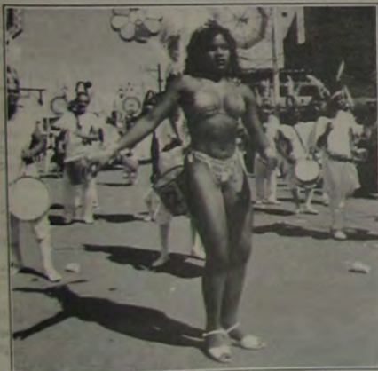
Certamente por se sentir um pouco culpada pelo esvaziamento do Carnaval iguaçuano, a Prefeitura está badalando, como nunca, os festejos de Momo deste ano.

Já estão abertas as inscrições para o concurso que vai escolher os integrantes da Corte Momesca de 1995.