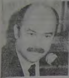
Boa vontade, deixou um poema que você deve ter como leitura constante: