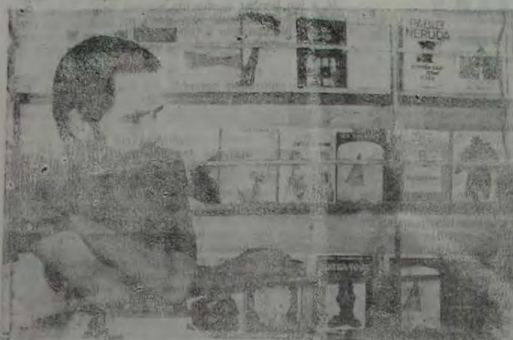
Cantalice está desanimado, desolado, mas com as dificuldades para a comercialização do livro em Nova Iguaçu, onde, segundo ele mesmo diz, ninguém lê.

«A venda de livros realmente assusta muita gente, porque o livro ilustra e o homem ilustrado é mais consciente e não votaria em muita gente que, hoje, está no poder.»