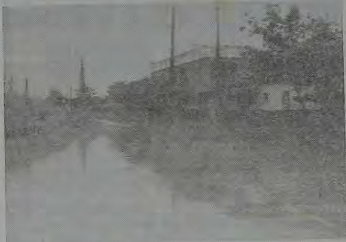
Nas últimas chuvas, o canal da Rua Gemini provocou grande inundação no Conjunto Grande Rio.