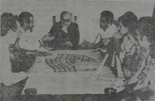
Aspecto da reunião realizada dia 10 no Centro de Formação de Líderes