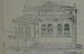
O antigo Fórum, na Praça João Pessoa, onde se instalava também a Câmara Municipal no terreno. Na parte superior do chamado Casarão Amarelado que funcionava o Fórum e, no subsolo, o Tribunal do Júri.