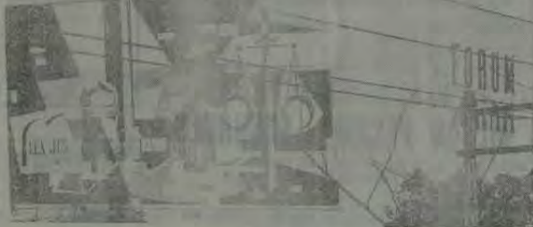
Novo Edifício do Fórum, inaugurado pelo Governador do Estado o Alm. Ananias Peixoto, a 21 de agosto de 1954.