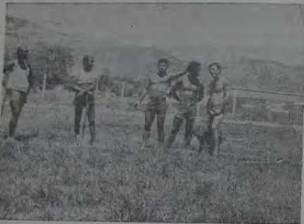
TORNEIO DE ESCOLINHA