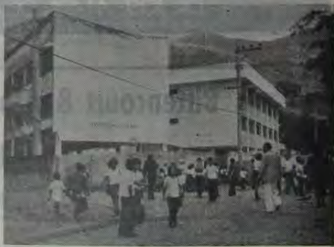
Por tudo que nos foi possível observar no Grupo Escolar D. Pedro I, em Mesquita, chegamos à conclusão que, pelo menos aqui em Nova Iguaçu, a política educacional do Governador Faria Lima está seriamente comprometida.