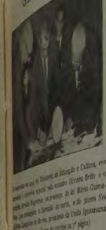
Alunos do Ginásio Municipal de Nova Iguaçu.

Mais 9 milhões para a Associação para a educação especial entre o Ministério da Educação e Cultura. A Prefeitura de Nova Iguaçu assegura a concessão do nosso auxílio ao nosso Ginásio Municipal!