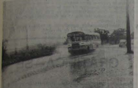
A Av. Roberto Silveira, por exemplo, deu bem a medida dos transtornos provocados pelas fortes chuvas desta semana no trânsito da cidade.