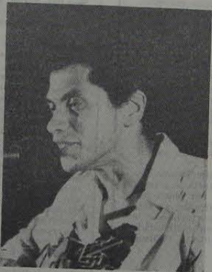
Comovente samba de Paulinho da Viola (foto).

* A novela Pecado Capital , que vinha sendo anunciada espetacularmente pela Globo, entrou no ar, trazendo um som altamente gratificante: um