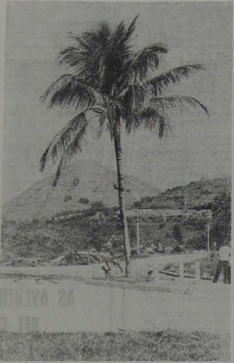
Em Cobrex só restou o coqueiro, na paisagem desfeita pela ansia do lucro fácil.

Segundo um funcionário da Prefeitura, aquela devastação nada tem a ver com a Administração Municipal. Segundo o mesmo quando a Prefeitura assumiu a posse da referida área, já havia sido iniciado o desmatamento, naturalmente por ordem dos antigos administradores da fábrica Cobrex. Afirma, inclusive, que não foram abalzo apenas as árvores, mas também todos os prédios ali existentes. Uma prática de terra arrasada. Isso no entanto não isenta a Administração Municipal de co-participação no crime, de vez que a mesma