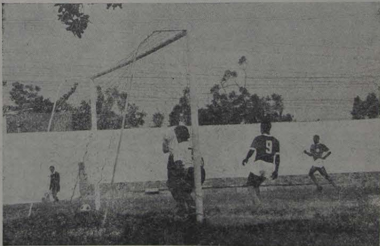
Com a vitória sobre Cachoeira de Macacu, nossa seleção deu um grande passo para sagrar-se o campeão de seu grupo.

O Campeonato continua no próximo dia 3. No Estádio do Volantes, Nova Iguaçu receberá o selecionado de Itaboraí e Nilópolis vai até Cachoeira de Macacu, na penúltima rodada desta fase semifinal do Campeonato Fluminense de Futebol Amador.