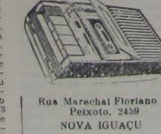
Rua Marechal Floriano Peixoto, 2459 NOVA IGUAÇU

Oficina Ticiano CONSERVAM-SE Gravadores, Toca-Fita, Rádios de Pilha e de Automóvel.