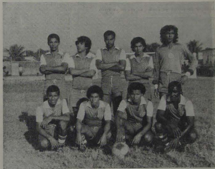
O QUADRO CAMPEAO