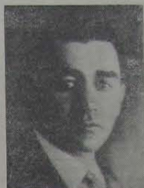
Figura das mais representativas do chamado movimento tenentista, Antonio de Siqueira Campos, militar e político brasileiro, nasceu no município de Rio Claro, Estado de São Paulo, em 1898. Cursou a Escola Militar de Realengo, atingindo no Exército o posto de primeiro-tenente. Contrário a posse de Artur Bernardes, participou do movimento revolucionário de 1922, encontrando-se entre os dezoito do forte de Copacabana lutando contra as forças do governo. Desse episódio revolucionário saiu com vida, ao lado de Eduardo Gomes. Em 1923, condenado pelo Governo Bernardes, deixou o país, asilando-se na Argentina. Retornou ao Brasil em 1924, integrando-se ao movimento revolucionário desse ano. Juntamente com Juarez Távora, sublevaram diversas unidades militares sediadas no Rio Grande do Sul e assumiu o comando de um dos flancos da Coluna Prestes, que se internou pelo interior do país. Na Coluna Prestes, couberam-lhe as mais difíceis missões, garantindo a movimentação das

forças revolucionárias. No Maranhão, foi o responsável pelo afundamento do navio que conduzia tropas do Governo Federal. Participou seguidamente de uma série de combates no Nordeste, no final da existência da Coluna Prestes.