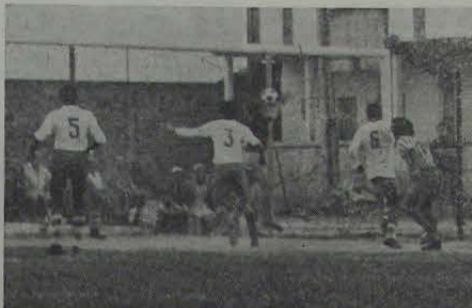
Apesar de não ter apontado o campeão da III Copa da Cidade, a partida entre Belford Roxo e Heliópolis apresentou lances de grande movimentação.

Belford Roxo e Heliópolis empataram (2 a 2) domingo passado, no campo neutro do Aliados, no jogo que seria o decisivo para indicar o campeão da III Copa Cidade de Nova Iguaçu (edição 72). Só sabemos agora qual será o clube campeão daquele certame no próximo dia 30, quando será realizada a partida final. No jogo de domingo, em virtude do adiantado da hora, não houve condições para que os dois jogadores jogassem os 30 minutos previstos de prorrogação.