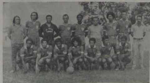
A seleção iguaçuana

Como parte dos preparativos para as eliminatórias do Campeonato Fluminense de Futebol Amador, a seleção iguaçuana venceu, em jogo treino, a representação do Morro Agudo F.C. pela contagem de 2 a 1. Esta partida realizou-se domingo último no Estádio Augusto Simões.