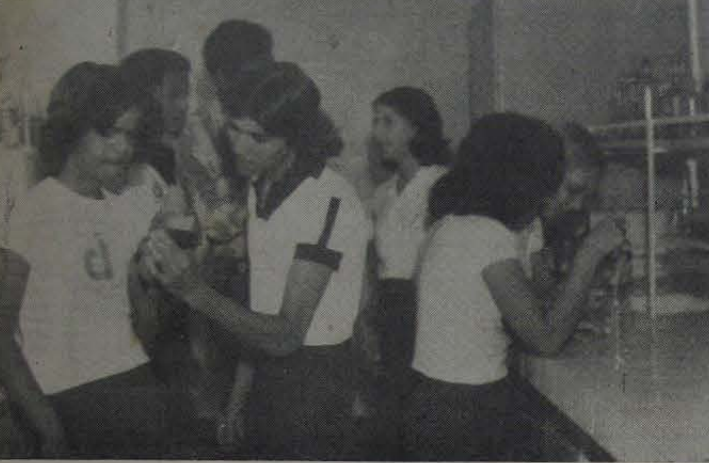
O 1.º Ano Básico durante uma aula prática no Laboratório de Química do Instituto Brasil

teremos diversos jogos infantis, quadrilhas e casamento caipira. Na segunda parte será realizado um animado baile com o conjunto "Os Cariocas Tropicais".