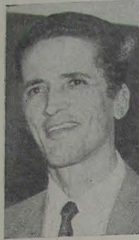
(foto) criando uma "Comissão Especial de Vereadores" para verificação da SUPONI...