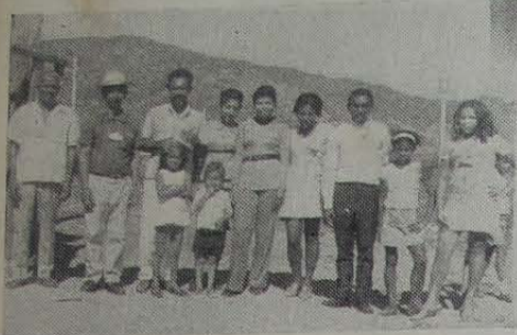
Dirigentes da Associação dos Moradores do Riachão querem ver o progresso do bairro

Riachão é um dos bairros mais esquecidos pelos poderes públicos, vivendo mesmo em situação de miséria. As condições de suas ruas são da pior espécie. Os seus numerosos moradores são lembrados apenas em época de eleições, estando entregues à própria sorte.