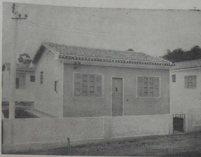
Uma das bonitas casas construídas pela OSÁRA, cujo acabamento é bem acentuado.