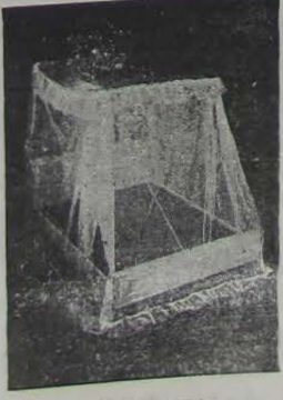
DIXIE de noite