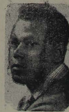
dos bons da Sollimões. Breve gravará duas melodias, um rojão e um baão. Salve ele!

Programa de grande repercussão levado ao ar de segunda a sábado, às 19 horas, é mais uma produção e apresentação de Adalberto Cantalice.