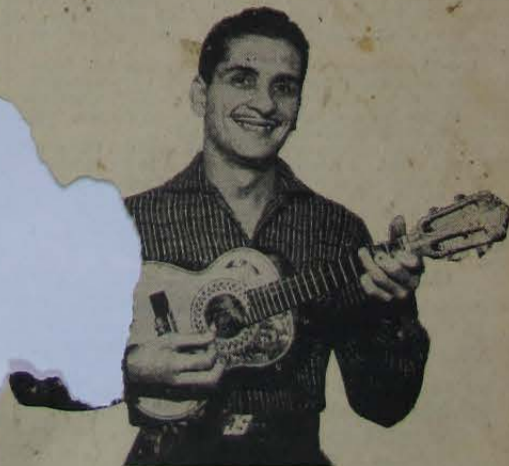
Este notável cavaquinista do rádio carioca vem brilhando também na Solimões todos os sábados, às 20 horas, acompanhando os calouros da "Hora do Apito" com seu regional. E no programa "Boa Noite, Amigos", colabora também com o regional do pro. "Figueira Salve" é!