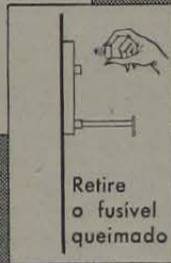
Retire o fusível queimado