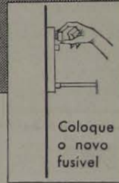
Coloque o novo fusível