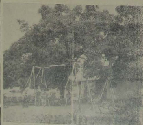
Para elas já está pronto o grande «playground», com muita variedade de brinquedos. Bela iniciativa, porque, afinal, o clube é de grandes e pequenos.