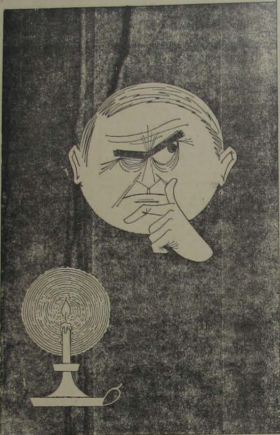
UMA CAMPANHA DA LIGHT EM SEU BENEFÍCIO