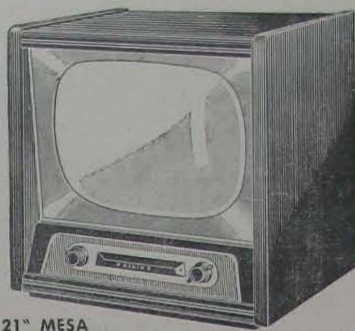
TV 21" MESA (21 TR 115-A/02)

Fácil manejo - Seletor de 13 canais - Novo tubo de 21" com tela aluminizada - Operação "não-sincrona" - 21 válvulas "Noval" e 3 díodos de germanium - Vidro protetor de 6mm de espessura.